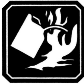
FUEGO CLASE B