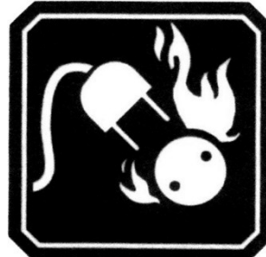
FUEGO CLASE C