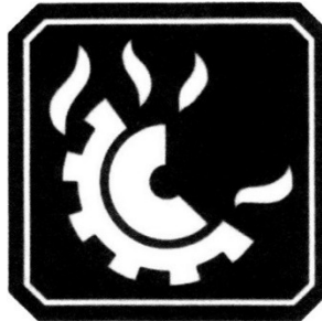
FUEGO CLASE D