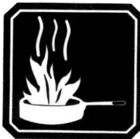
FUEGO CLASE K