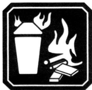
FUEGO CLASE A